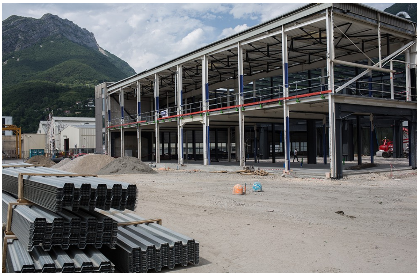
Le chantier du futur site d'innovation de Vekor, à Grenoble, le 23 mai 2022.